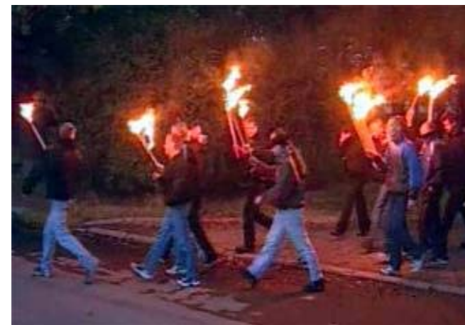
Скинхеды. Факельное шествие в Петербурге.