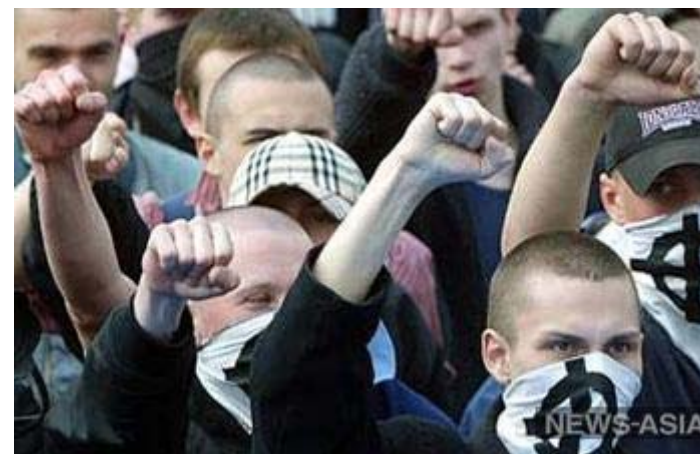
В Костроме скинхеды напали на неформалов