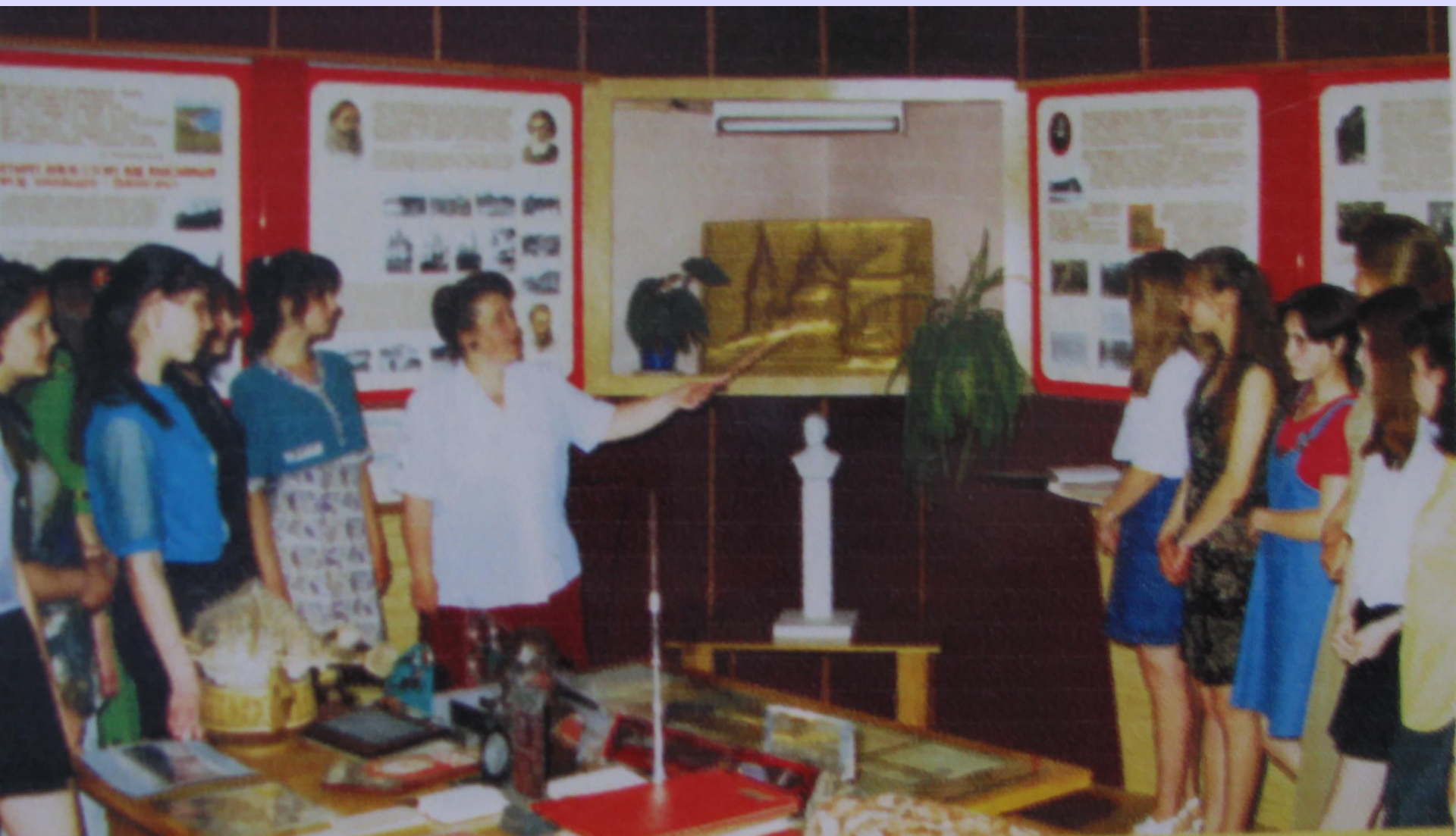
Музей истории техникума