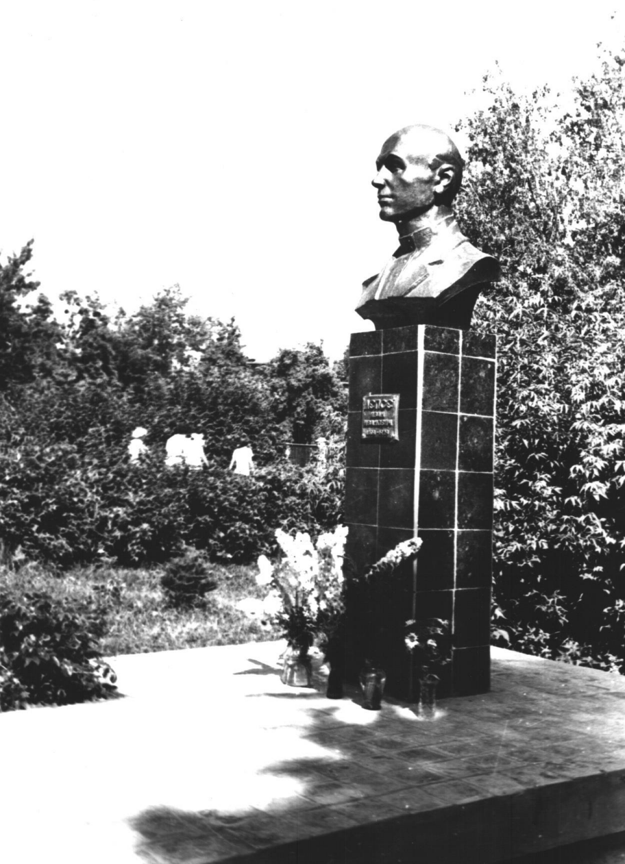
Открытие памятника И.И. Лепсе у техникума в 1988 г.