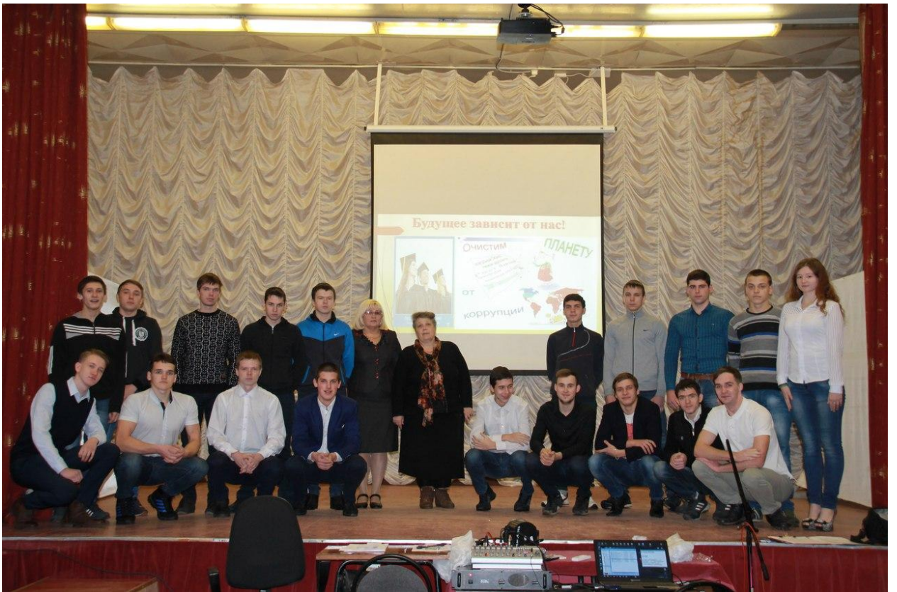
Внеклассное мероприятие: Деловая игра «Я- никогда не буду коррупционером»