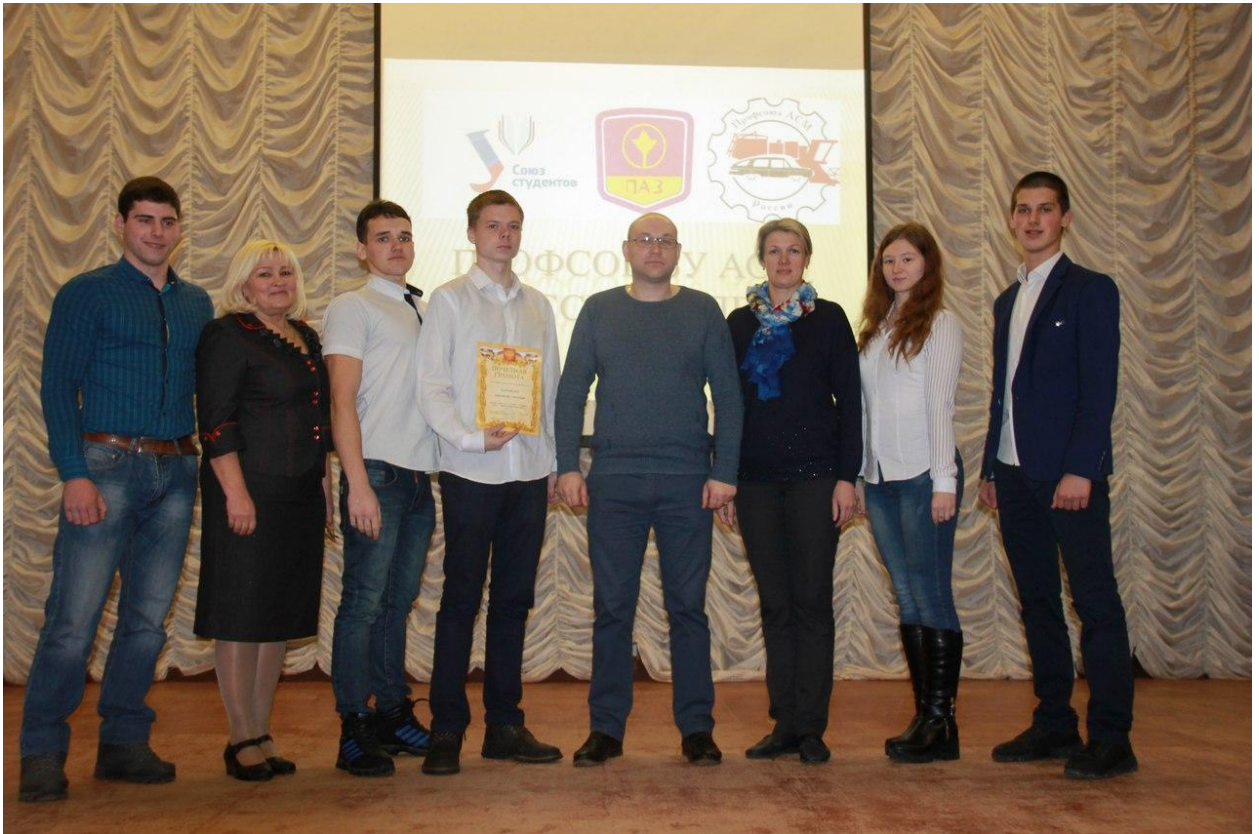
Производственное профсоюзное совещание с работниками и студентами техникума по вопросу «Международная кампания ООН по борьбе с коррупцией»